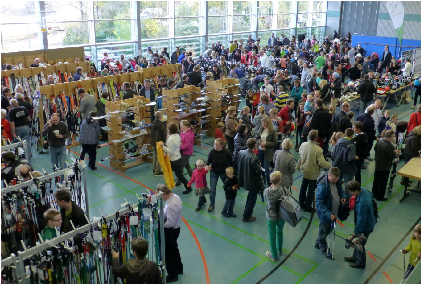
Skibörse in der Georgii-Halle, Leonberg

Beratung durch fachkundige Übungsleiter der NaturFreunde Schneesportschule Böblingen + Leonberg, sowie durch erfahrene Ski- und Snowboardfahrer.