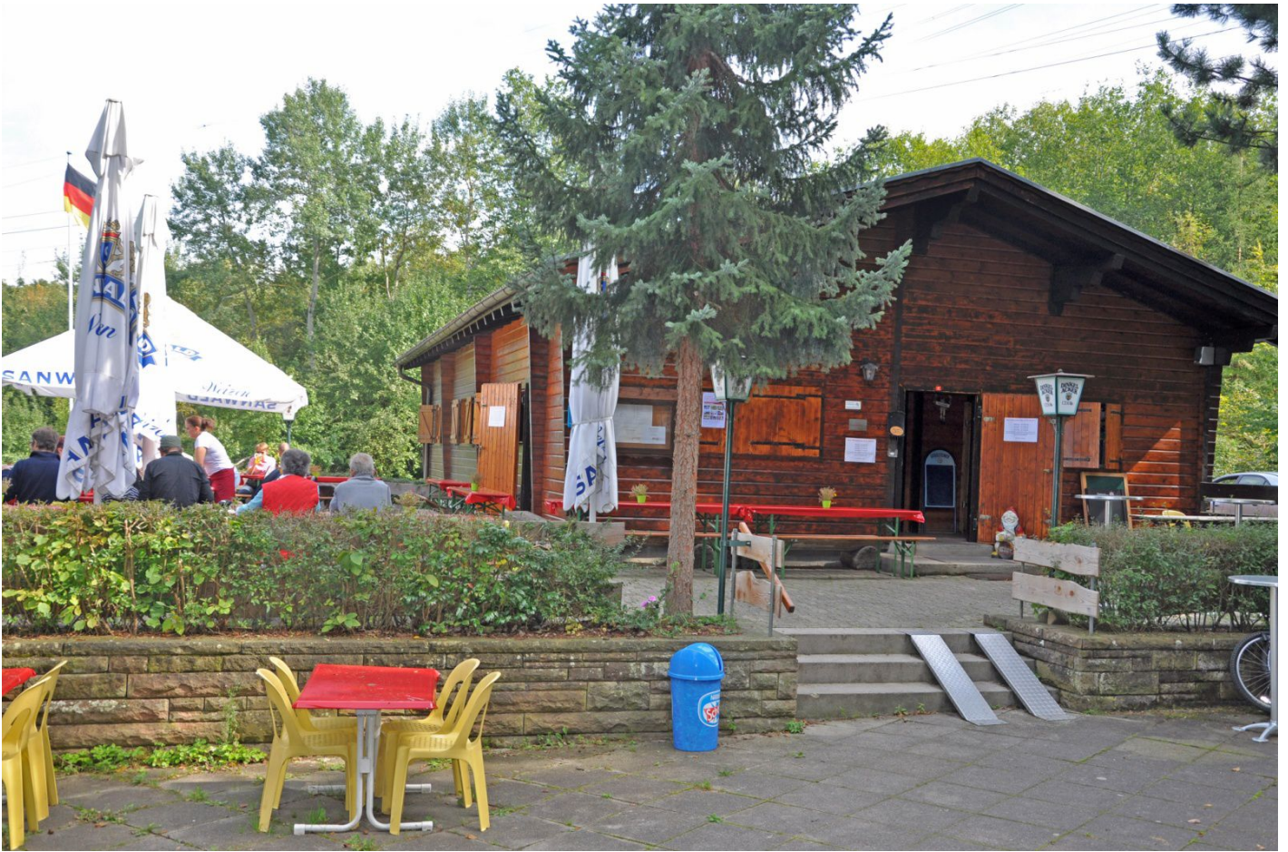
Unser Vereinsheim und Wanderstützpunkt "Wanne"